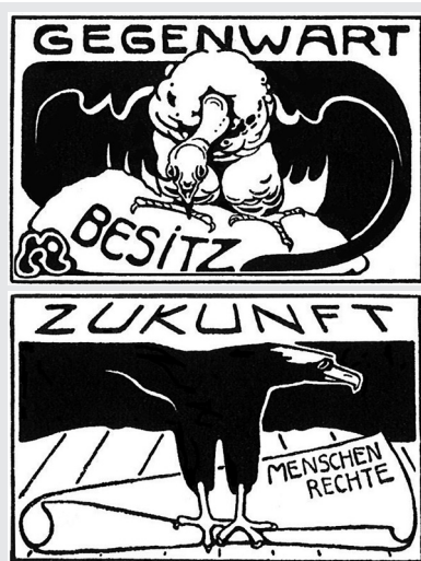
aus Maizeitung der SPD 1906

In einem Beispiel ist es ganz einfach so: In einer Firma gibt es drei Personen, die alles